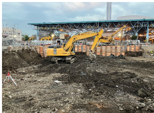
破碎処理棟 根伐状況