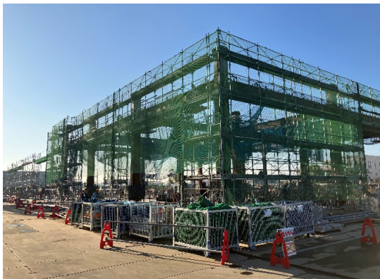
選別処理棟 外部足場組立状況