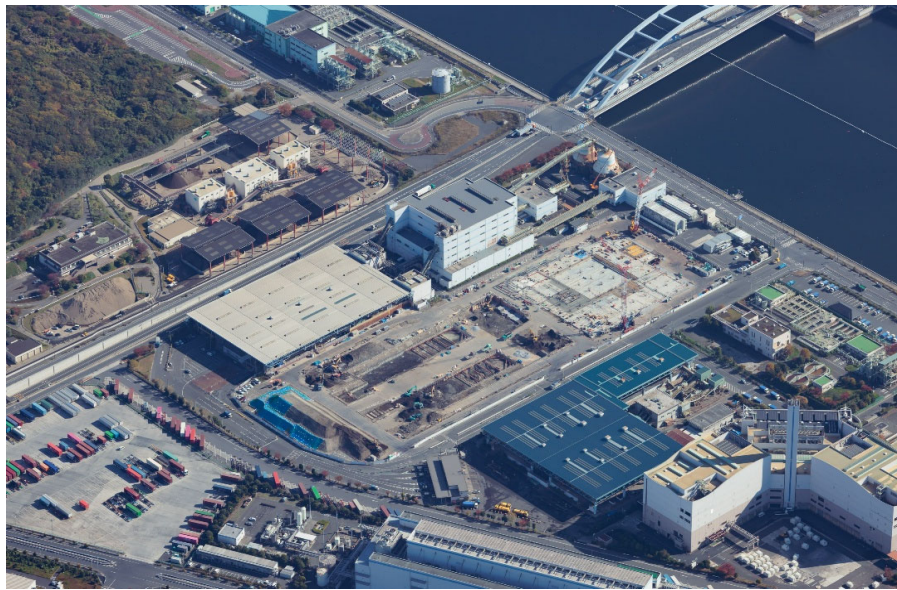
令和7年11月 航空写真