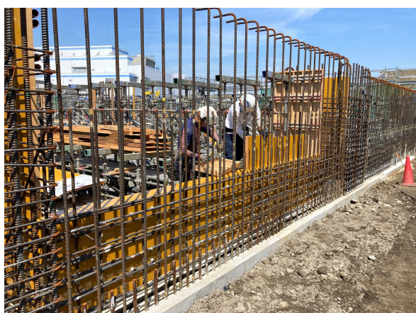
受入貯留ヤード棟 型枠建込状況