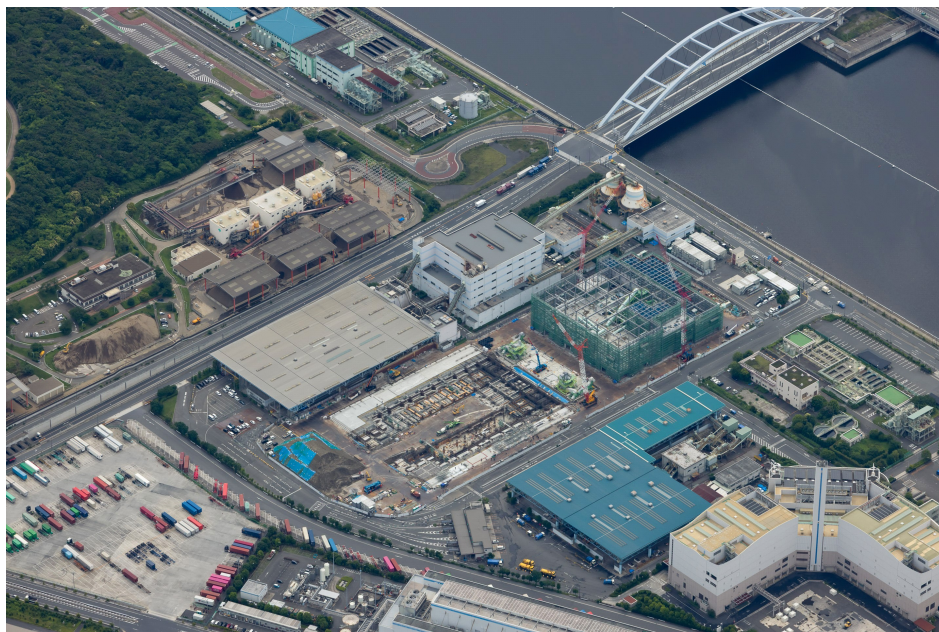
令和8年6月 航空写真