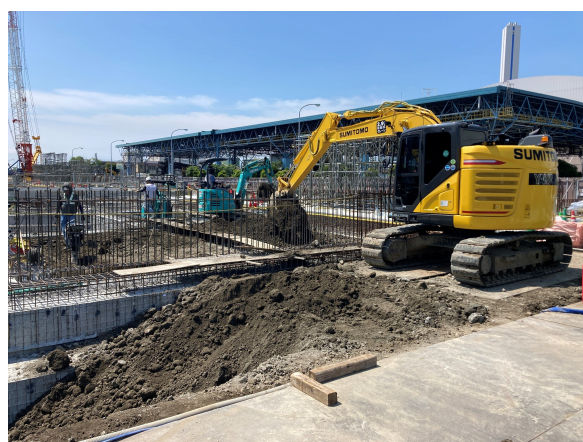
受入貯留ヤード棟 埋め戻し状況