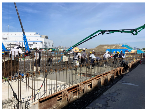
受入貯留ヤード棟 1階スラブ打設状況